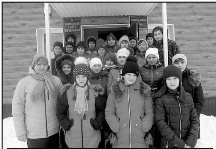
На снимке: волонтеры около районного музея.

Благодаря таким акциям укрепляется связь поколений, проводится патриотическое воспитание молодежи. Ведь и ребята, и взрослые вспоминают всех, кто, не щадя себя, сражался за нашу свободу и счастье. Вечная память тем солдатам победы, кто не вернулся из боя, кто не дожил до юбилейной даты. Почет и уважение ветеранам войны и труда, вдовам погибших солдат, детям Сталинграда - всем, кто продолжает оли-