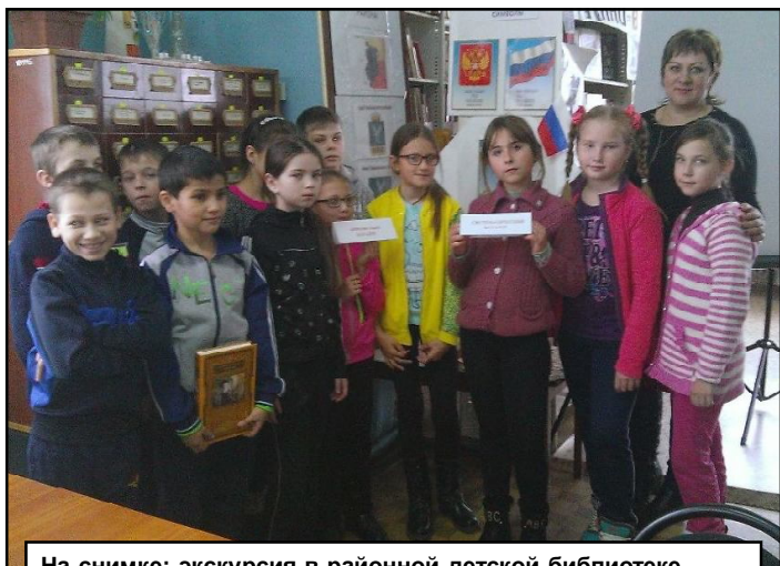
На снимке: экскурсия в районной детской библиотеке.